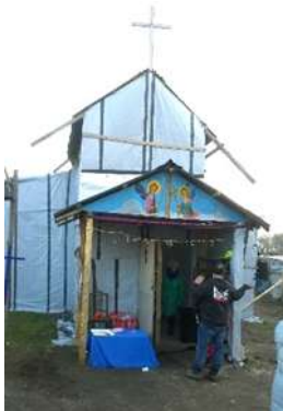
Chapelle que s'étaient construite les éthiopiens dans la « jungle » à Calais